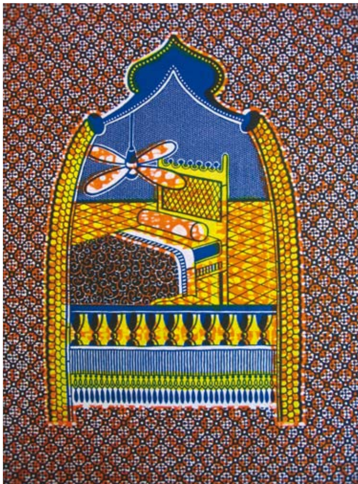
'Kom naar mijn slaapkamer op je sandalen.'