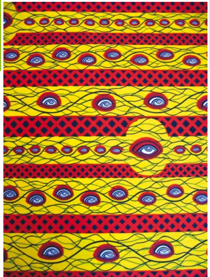
'Het oog van mijn rivale.'

iemand die rijk is kan het zich veroorloven in een zescilinder auto te rijden. In de volksmond krijgt het dessin echter een geheel andere betekenis. De dame in het midden van het doek zou van wanten weten en zes mannen 'aankunnen'. Een ander zeer geliefd dessin in Belgisch Kongo was Zoba Zoba wat stukjes betekent. Het is samengesteld uit verschillende, meestal bekende, dessins. Met zo'n jurk gaf de draagster aan dat zij alle daarin verwerkte dessins in haar bezit had. De vrouwen gebruikten de Zoba Zoba als wandelende toonkamer.