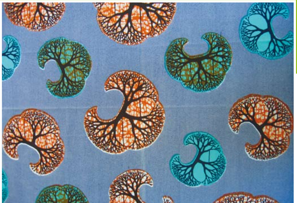
'Het brein van Kofi Anan.'

her bestaan deze zakdoeken in twee maten: kleine voor in je zak noem je mouchoirs en de grote, voor om je hals of hoofd heten foulards . In het buitenland zie je vaak de op de boerenzakdoek geïnspireerde bandana's , die meestal iets kleiner van formaat zijn en van dunnere stof gemaakt.