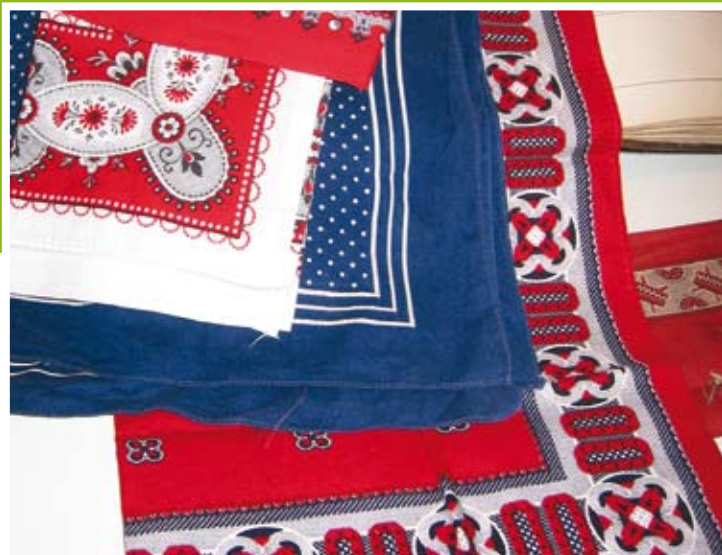
De rode boerenzakdoek was bedoeld voor doordeweeks gebruik. Op zondag droegen de mannen een witte met rode motieven en de vrouwen een helemaal witte zakdoek. Wit met zwart was voor de rouw en wit met donkerblauw voor de halve rouw.